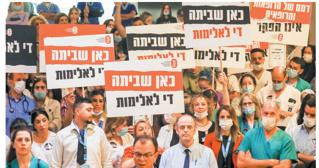
"יש חששות". הפגנת צוותי רפואה נגד האלימות כלפיהם

פרופ' תורן: "אנחנו מתקרבים היום ל-20% גברים במקצוע. בשיעורים כבר לא מדברים בלשון נקבה בלבד. המועמדים הגברים מגיעים אלינו מכל הקשת החברתית, ואין הבדל בין גבר לאישה לא בקבלה למסלול ולא בתוך הלימודים. אני שמחה שיש גיוון" שיש גיוון"