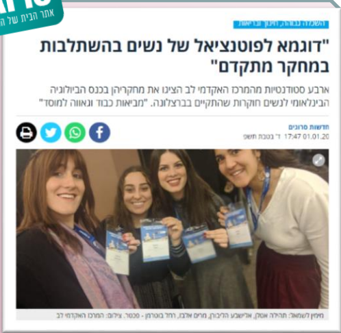
סטודנטיות מקמפוס טל בכנס מדעי בברצלונה