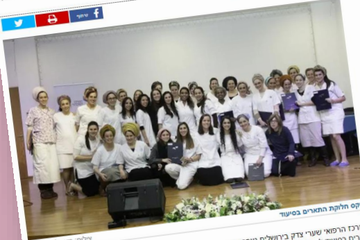
טקס חלוקת התארים בסיעוד

43 בוגרות סיימו מסלול אחות מוסמכת אקדמית, המשותף למרכז האקדמי לב ושערי צדק, "אני מייצגת לכן בחיך - כשיש לכן זמן ולשבת, שבו". אורי הירי, כ"ה שבט ה'תש"פ 22:52 22:01:20