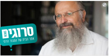
הרב שמואל אליהו.

קמפוס טל של המרכז האקדמי לב אירח את הרב שמואל אליהו, במסגרת קורס ייחודי בשם "מיהו יהודי", אשר נפתח בסמסטר הנוכחי.