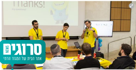
הסטודנטים עומים לשאלות הסיקסים. צילום: מיכאל ארברגר תורכר האקדמי לב

חדשות סרוגים 17:40 02.01.20 ה'ר הבסת תשפ